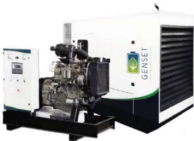
A imagem apresentada pode não refletir a configuração real.