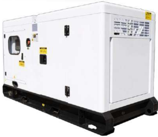
A imagem apresentada pode não refletir a configuração real.