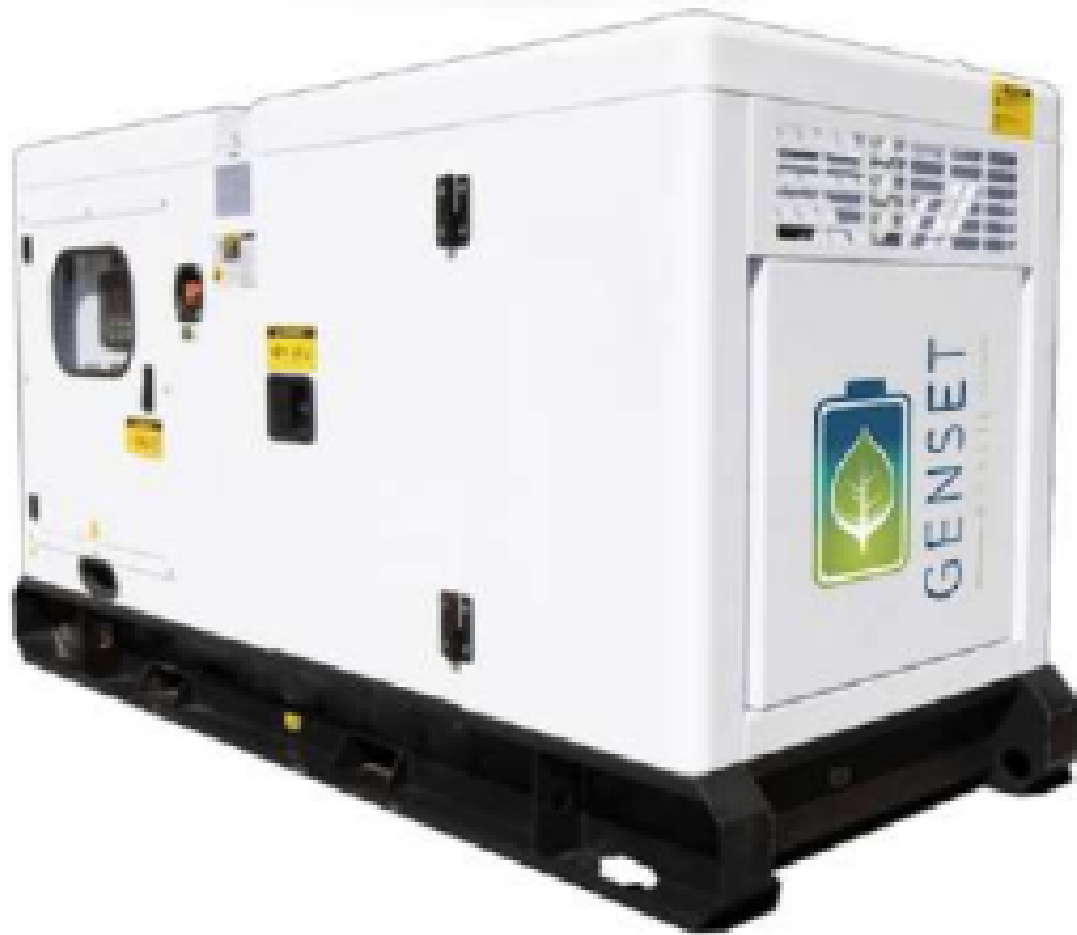
A imagem apresentada pode não refletir a configuração real.